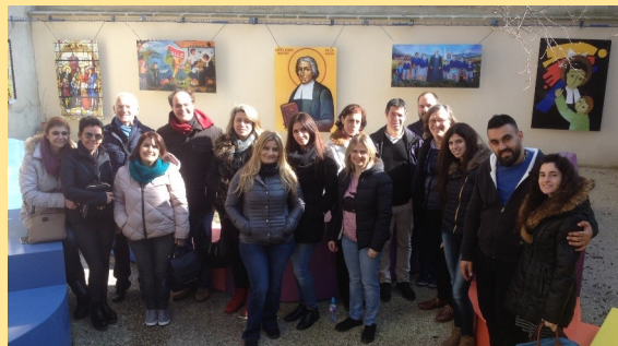
A la l'Hôtel de La salle à Reims le WE d'arrivée

Par l'ASSEDIL, voilà 3 ans, naissait le partenariat Franco-Libanais. Parti d'une volonté de renforcer l'aisance linguistique des professeurs libanais qui enseignent en langue française, le