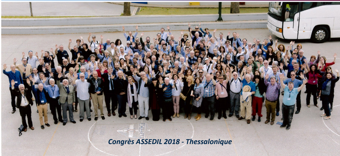
Congrès ASSEDIL 2018 - Thessalonique